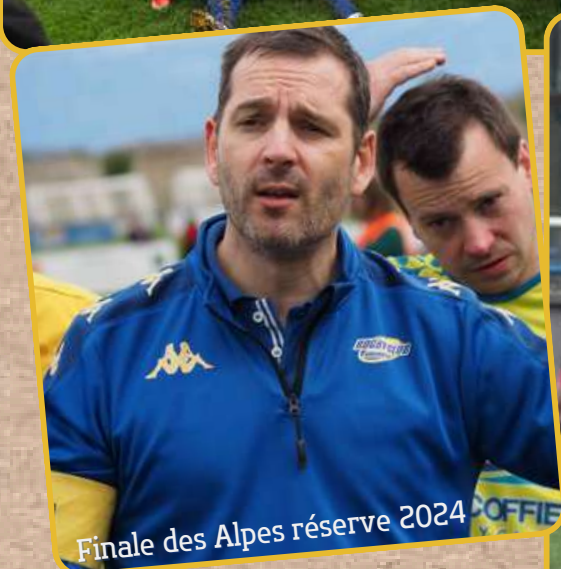
Finale des Alpes réserve 2024