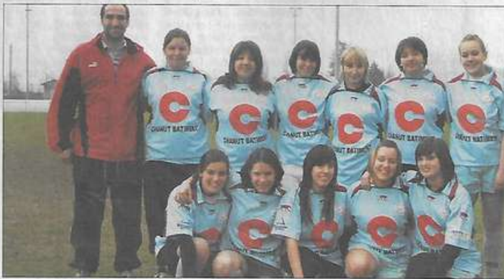
Le groupe des cadettes participe à des tournois.