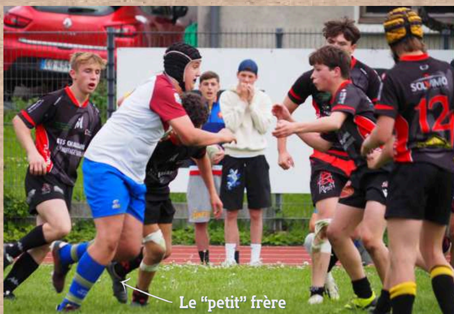
Le "petit" frère