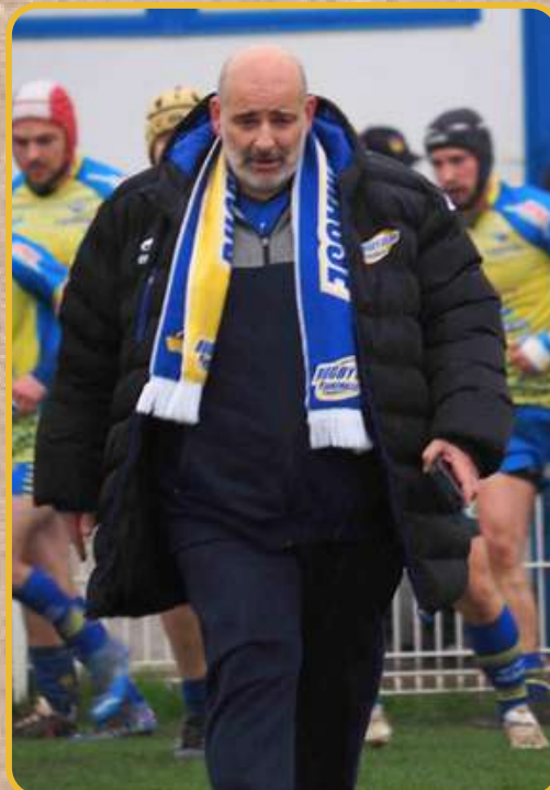
Le fiston qui a arrêté en 2023