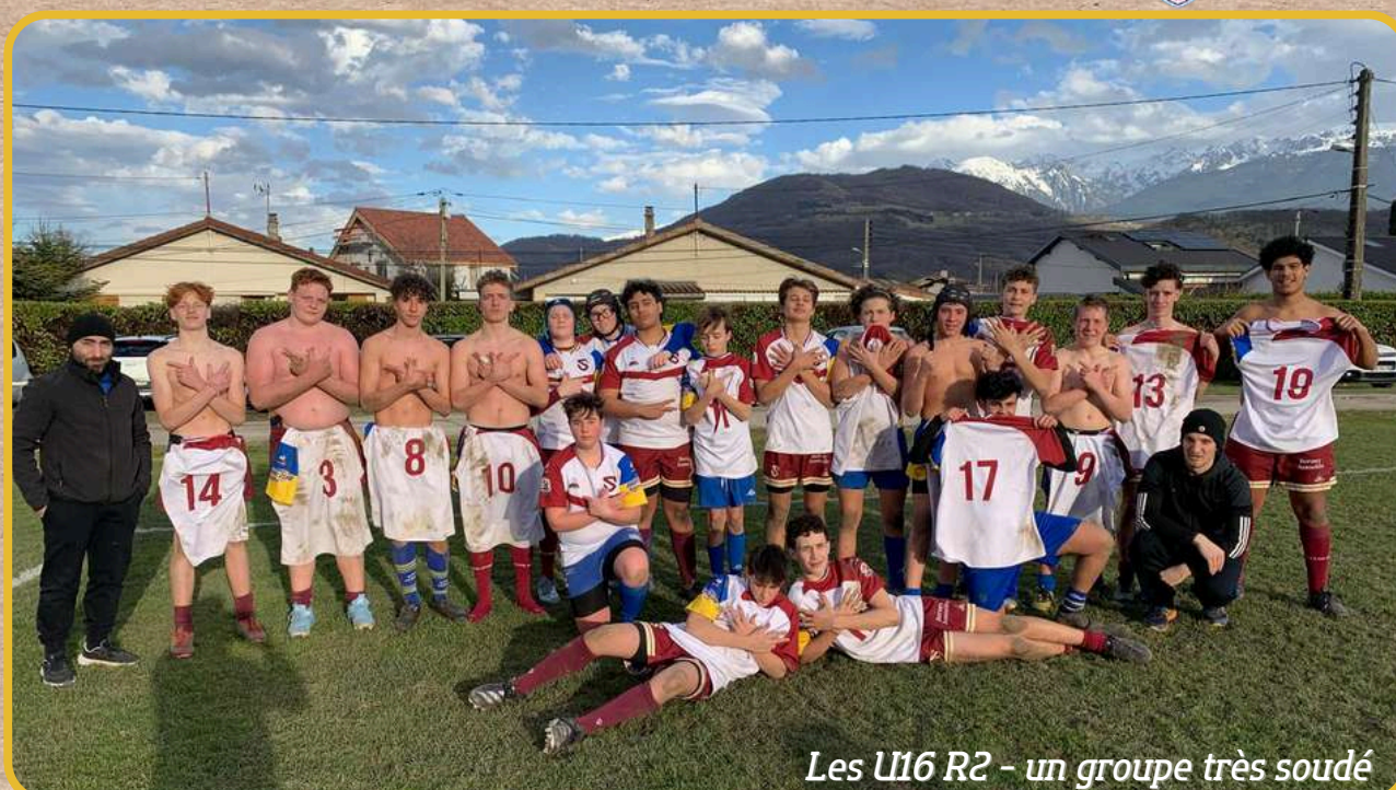
Les U16 R2 - un groupe très soudé