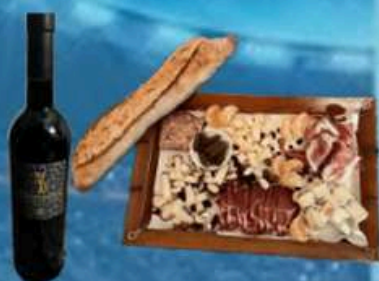
Planche apéro, snaking pour rendre l'expérience encore plus agréable!!

(Stade Henry Jeantet, rue Clément Ader, 79100 ANNEMASSE)